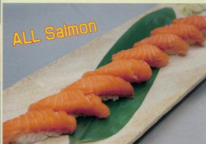
サーモンづくし 1800円 1944円 (税込) SALMON ZUKUSHI