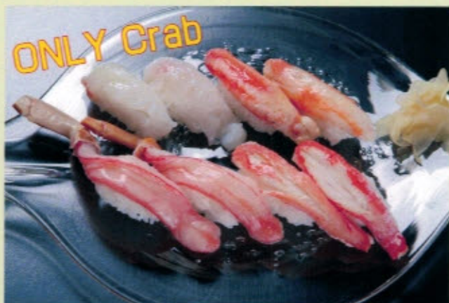
カニづくし 3500円 3780円 (税込) KANI ZUKUSHI