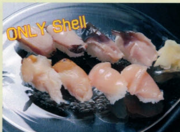
貝づくし 2600円 2808円 (税込) KAI ZUKUSHI