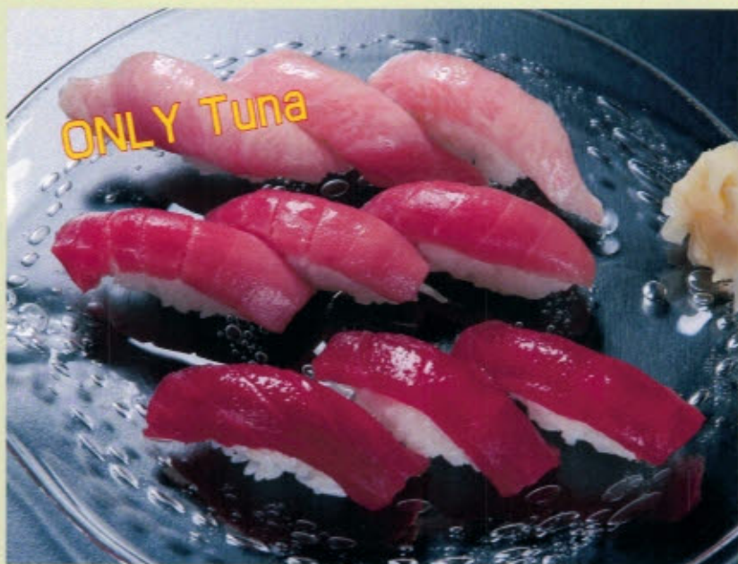
まぐろづくし 3300円 3564円 (税込) MAGURO ZUKUSHI