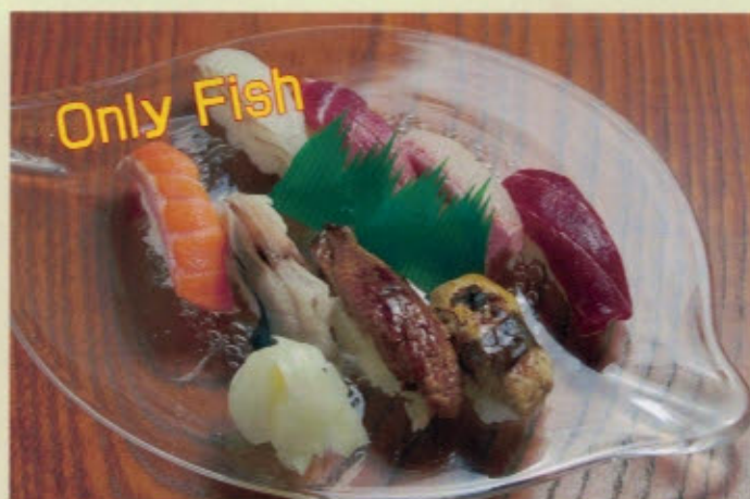
魚づくし 2000円 2160円 (税込) SAKANA ZUKUSHI