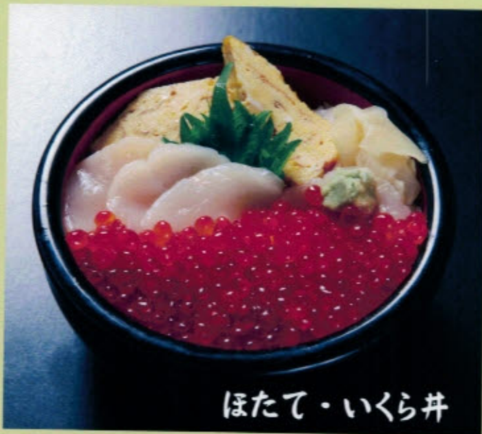
ほたて・いくら丼